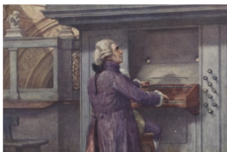
Joseph Haydn an der Orgel in Mariabrunn, bei Wien (Stich aus dem 19. Jahrhundert)

konzert gehört als einziges zum Standardrepertoire. Das erste Orgelkonzert, ein Jugendwerk, komponierte er 1756, in seiner ersten Phase als freischaffender Musiker. Stilistisch orientiert sich Haydn am Italiener Nicola Porpora, als dessen Kammerdiener und Begleiter er zu jener Zeit tätig war. Zudem erinnern Haydns Orgelkonzerte stark an die weit bekannteren von Händel. Die Trompeten- und Paukenstimmen wurden vermutlich später von fremder Hand ergänzt. Das Werk zeichnet sich aus durch seine Frische und Verspieltheit, insbesondere im virtuosen Orgelpart.