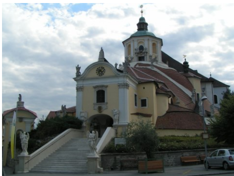
Die Bergkirche zu Eisenstadt

Diese sechs Spätmissen, deren Beinamen übrigens nicht von Haydn selbst stammen, widerspiegeln die oberste Stufe des kirchenmusikalischen Schaffens der Wiener Klassik. Haydn schlägt in ihnen kompositorisch die Brücke zur von ihm selbst wegweisend geprägten Gattung der Sinfonie und verbindet Orchester, Chor und Soli zu einer ausgewogenen Einheit.