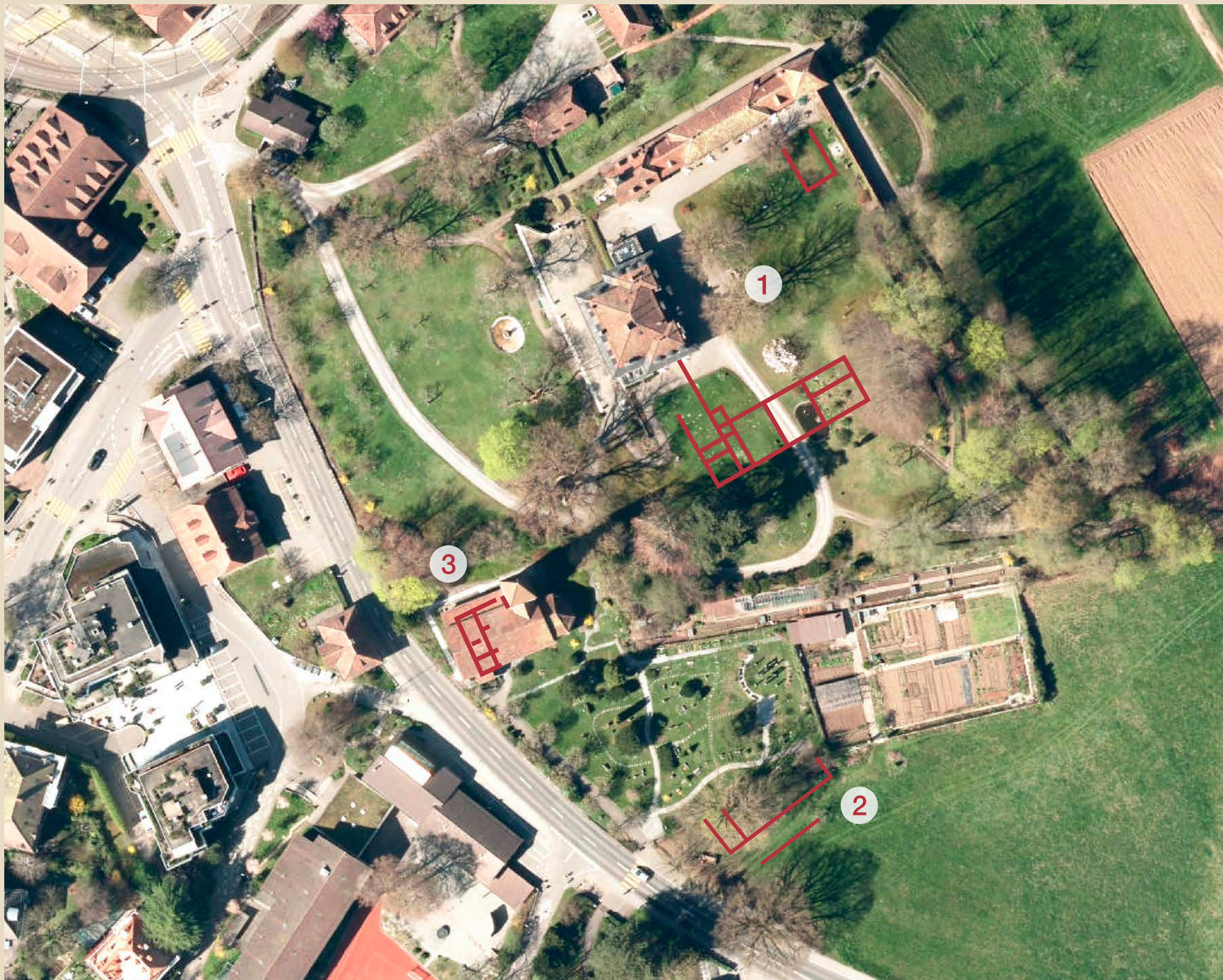
Schloss und Kirche Muri. Auf dem Luftbild sind die bis heute bekannten Mauerzüge der römischen Villa eingezeichnet.