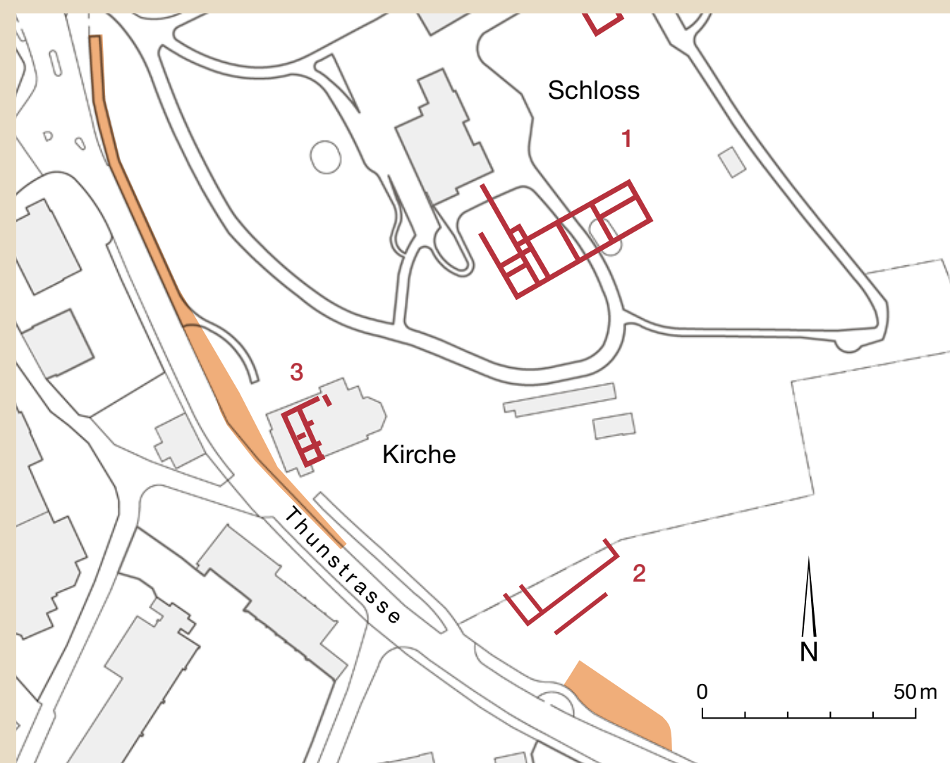
Katasterplan mit den von den geplanten Baumassnahmen betroffenen Arealen (orange). In den eingezeichneten Bereichen sind archäologische Sondierungen und möglicherweise Grabungen vorgesehen.

Auf dem Schlosshügel von Muri stand vor knapp 2000 Jahren ein römischer Gutshof, eine villa rustica . Wiederholt kamen bei Aushub- und Abbrucharbeiten in der Umgebung des Schlosses und des alten Pfarrhauses römische Mauerzüge und Funde zum Vorschein. 1832 wurden bei Arbeiten westlich des Schlosses Räume des Hauptgebäudes der villa ausgegraben (1). Dabei wurde ein ausserordentlicher Fund gehoben: eine Statue der Dea Artio , einer gallischen Jagd- und Bärengöttin, welche heute im Bernischen Historischen Museum ausgestellt ist.