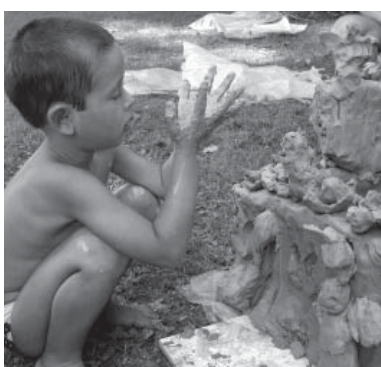
Eine riesige Fabelburg ist aus Ton entstanden, leider nicht auf Dauer.

In diesem Jahr stand Turmspringen im Zentrum der Wasseraktivitäten. Hier üben sich die zukünftige Olympioniken im gemeinsamen Sprung ins Wasser.