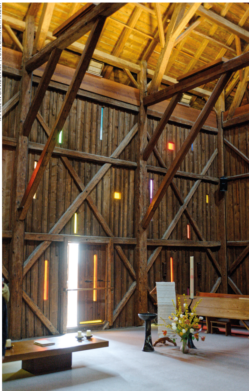
KAPELLE IN GRANDCHAMP | FOTO: CHRISTOPH KNOCH