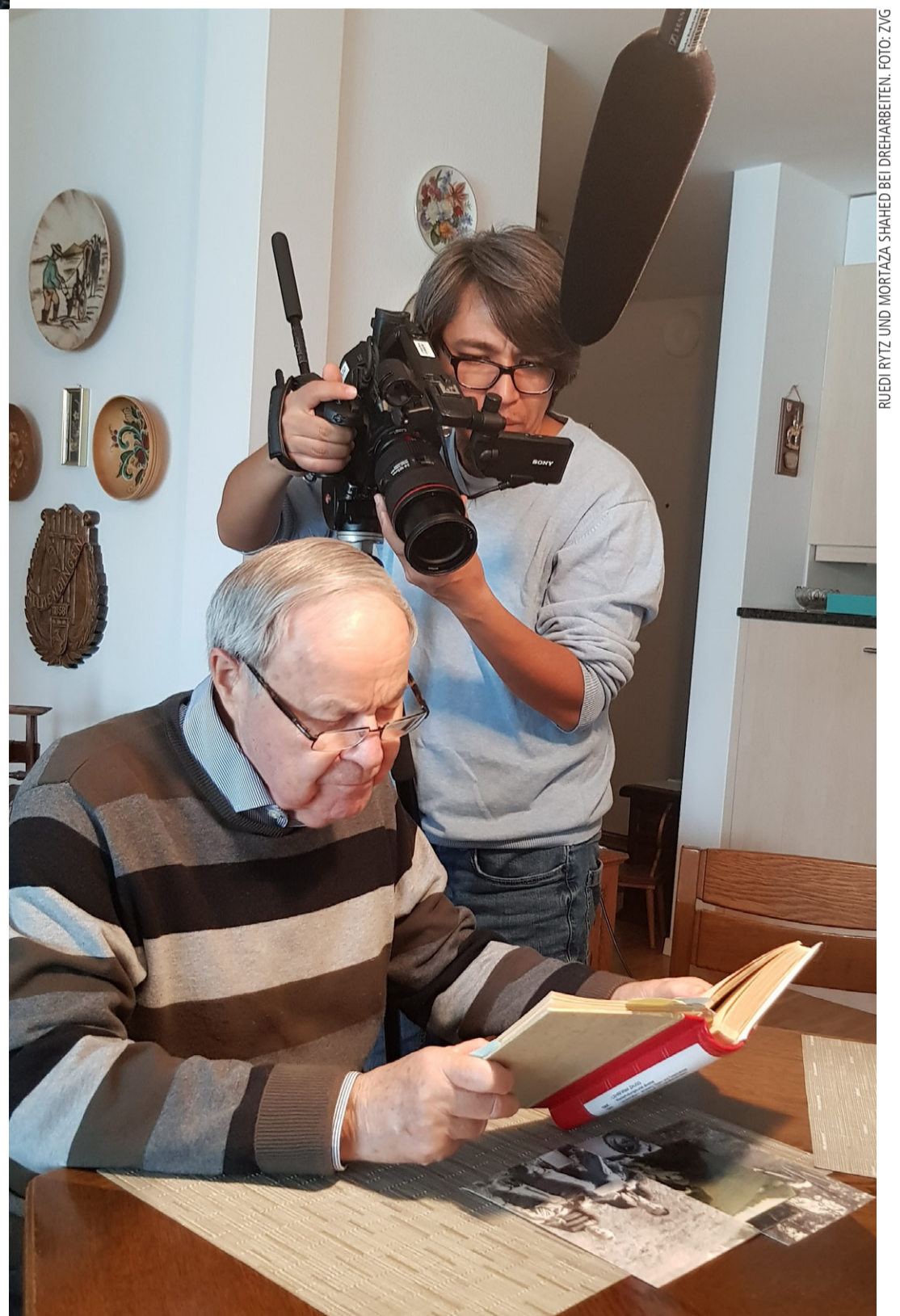
RUEDI RYTZ UND MORTAZA SHAHED BEI DREHARBEITEN.