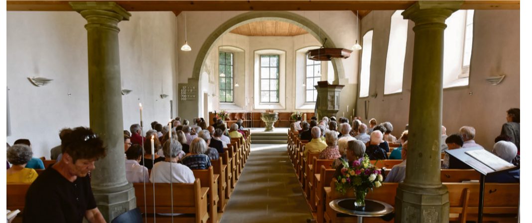
GOTTESDIENST AM 19. AUGUST 2018.