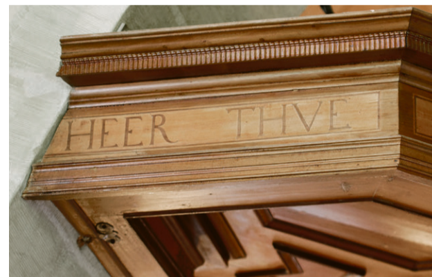
KANZELDECKEL 1673.