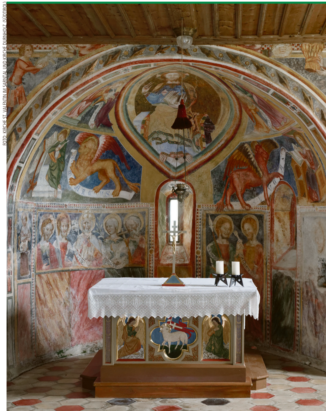
FOTO: KIRCHE ST. VALENTIN IM SARNATAL UND KIRCHE DURNHOLZ (SÜDTIROL)