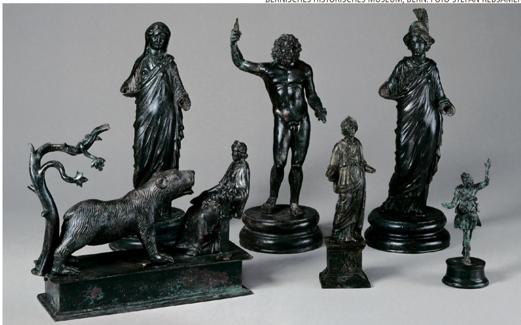
BERNISCHES HISTORISCHES MUSEUM, BERN. FOTO STEFAN REBSAMEN