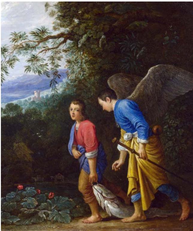
«Der Engel Raphael geht mit» (Tobit 5, 18).