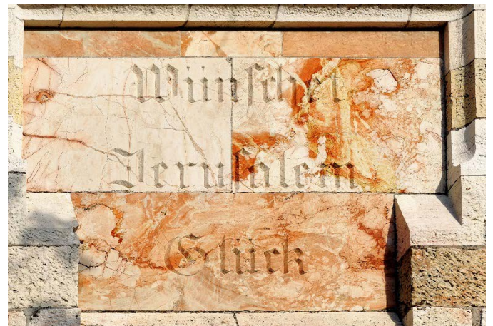
Alte Propstei, Prophetenstrasse Jerusalem, ck 2012