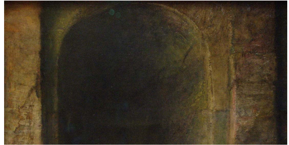
Bild der Nische

Unsichtbar bleibt das Geheimnis von Ostern.