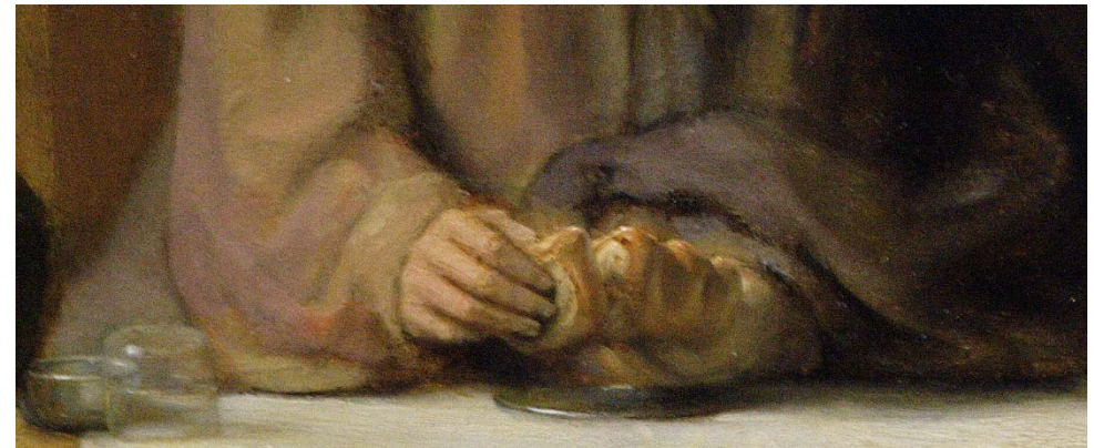
Bild vom Brot

Und doch: 30 Und es geschah, als er sich mit ihnen zu Tisch gesetzt hatte, dass er das Brot nahm, den Lobpreis sprach, es brach und ihnen gab. 31 Da wurden ihnen die Augen aufgetan, und sie erkannten ihn. Und schon war er nicht mehr zu sehen.