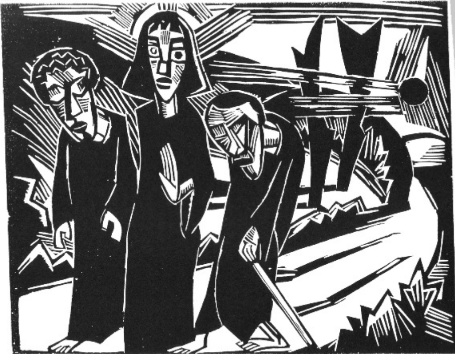
Karl Schmidt-Rottluff, Emmaus (1918) heute MoMa New York

Viele haben diese Szene in Bildern umgesetzt. Ganz anders sieht es der Maler und Holzschneider Karl Schmidt-Rottluff, der seinen Emmaus-Zyklus vor genau 100 Jahren geschaffen hat.