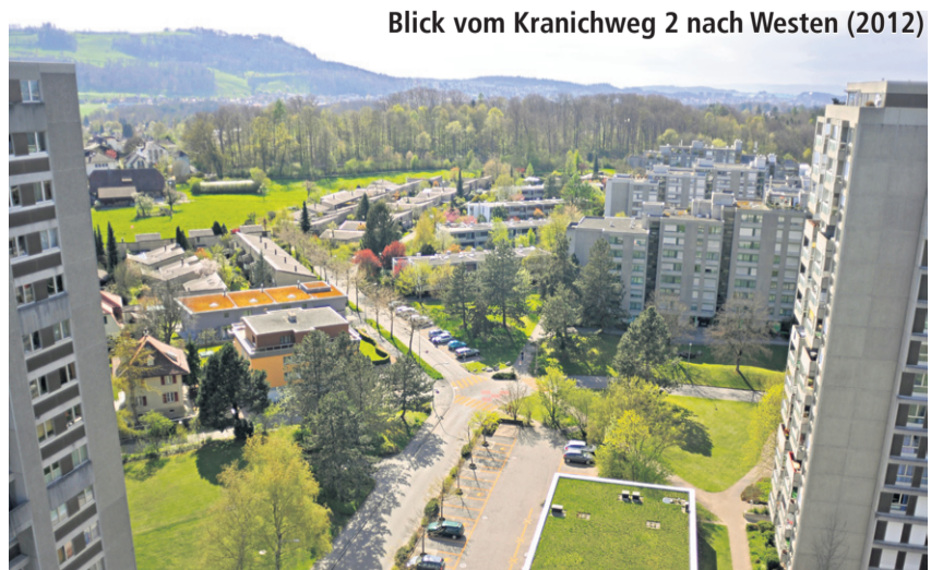
Blick vom Kranichweg 2 nach Westen (2012)