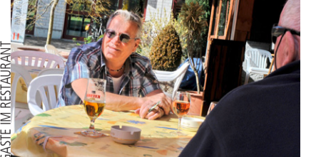
GÄSTE IM RESTAURANT