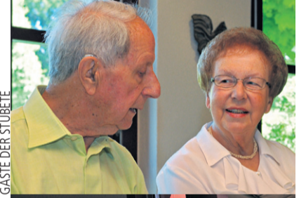
GÄSTE DER STUBETE