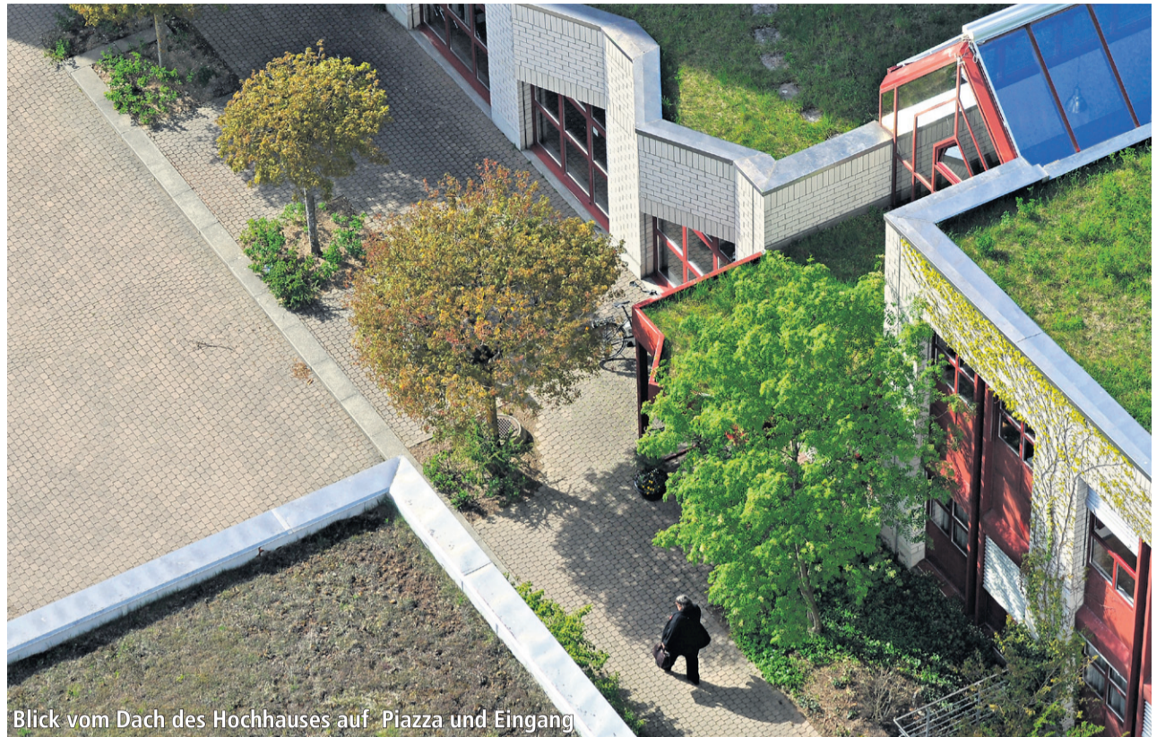
Blick vom Dach des Hochhauses auf Piazza und Eingang