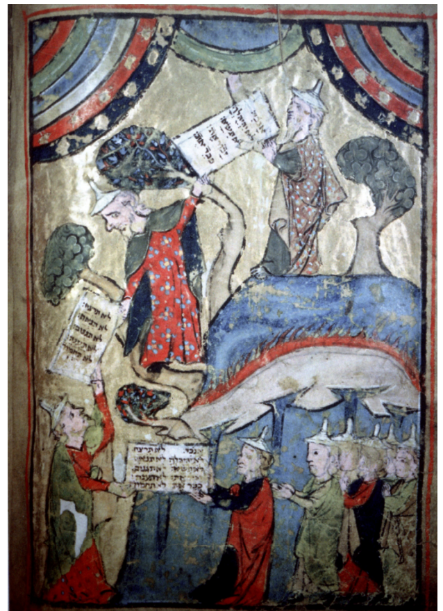
Mose erhält die Gebote und gibt sie dem Volk weiter