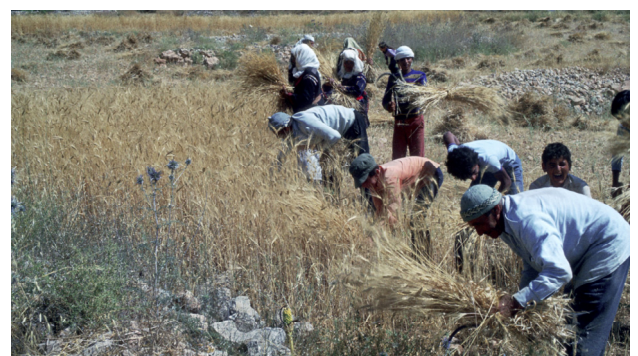
Die Garbenernte bei Ramallah (17.6.1980)