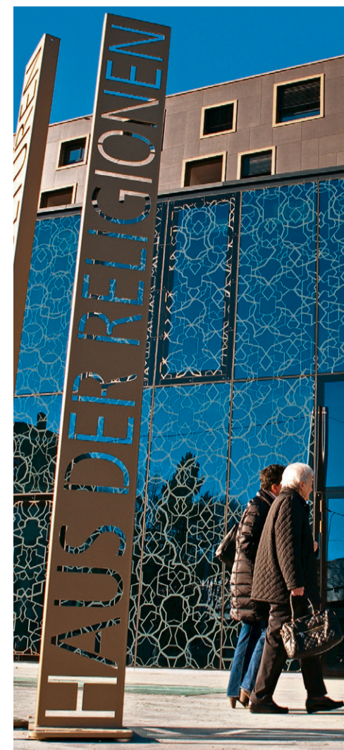
Haus der Religionen