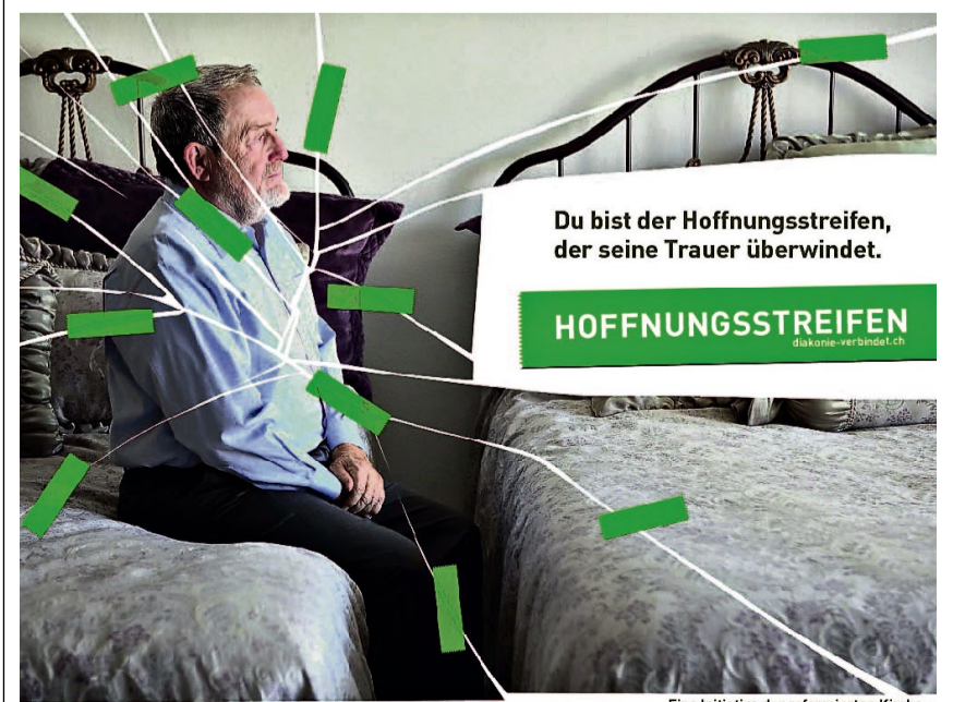
Eine Initiative der reformierten Kirche