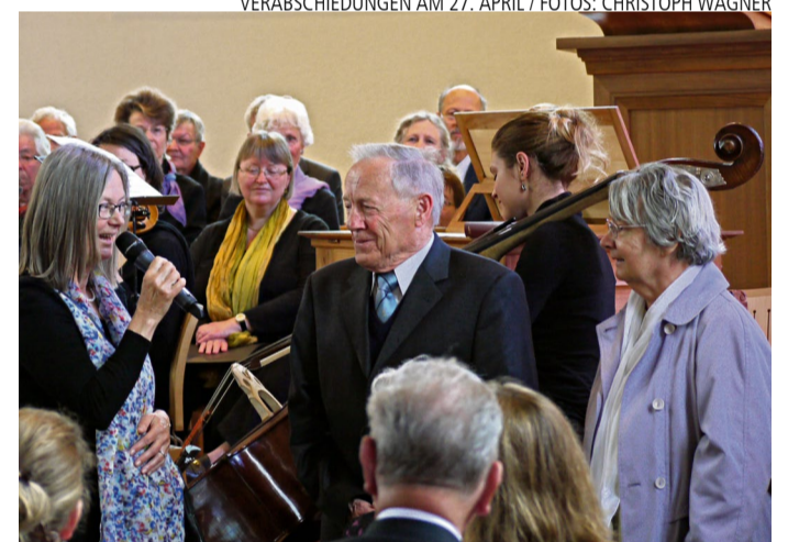
VERABSCHIEDUNGEN AM 27. APRIL