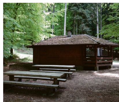
Freitag, 24. Juli 2026: Spaziergang zur Rütiwäldli Hütte in Ittigen.