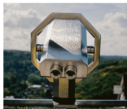
Mittwoch, 22. Juli 2026: Ausflug auf den Weissenstein.