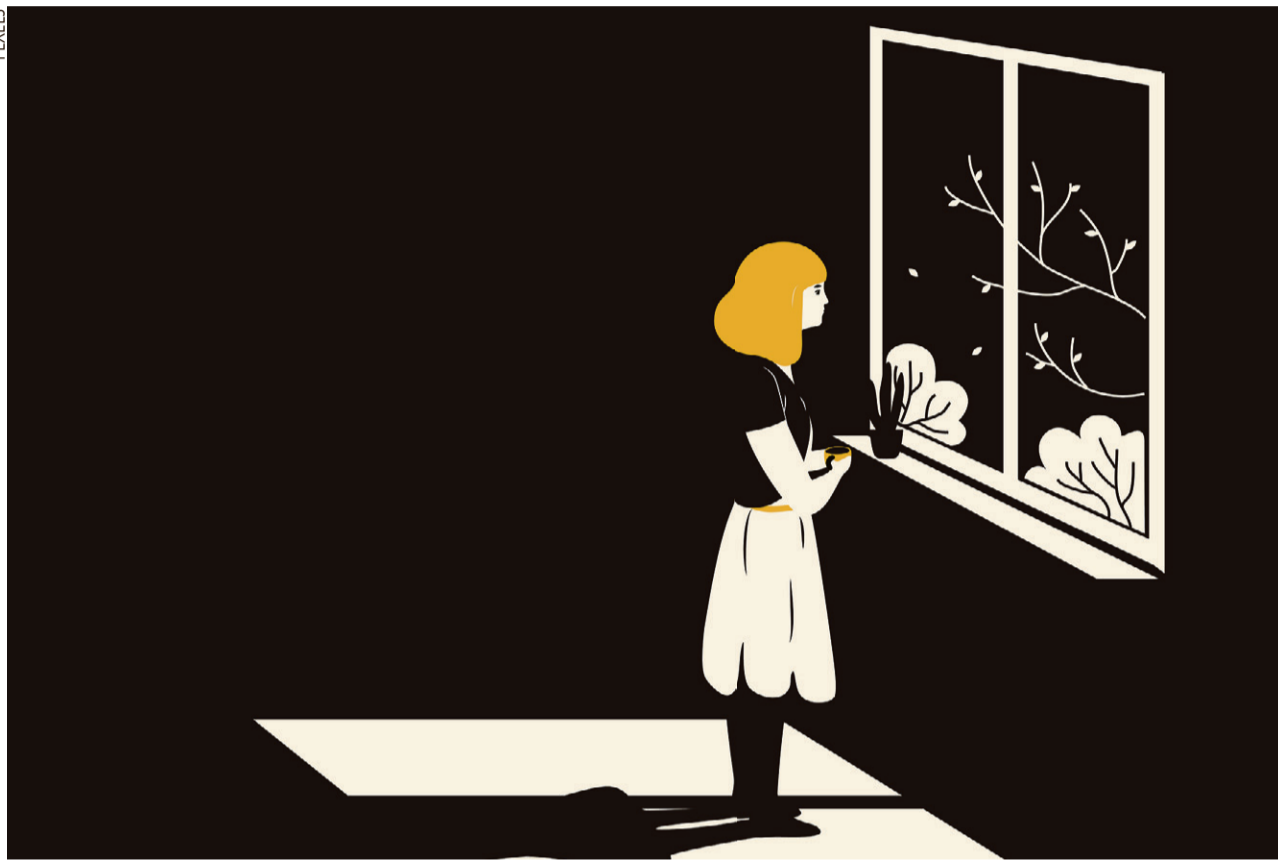
Das Zuhause, vertraute Umgebungen, Freunde, Verwandte ... nach einer Flucht ist alles weg – und alles anders.

... alles, was mich definierte, weg ist? Diese Fragen stellen sich Flüchtlinge, wenn sie alles zurück lassen und nochmals neu beginnen müssen. Am Flüchtlingssonntag hören und schauen wir genauer hin.