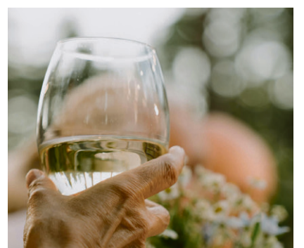
Freitag, 7. August 2026: Das grosse Sommerfest im Thoracher.