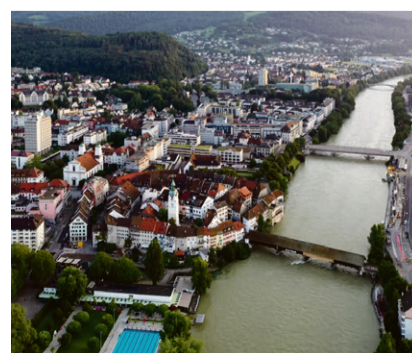
Montag, 3. August 2026: Olten mit historischer Stadtführung.