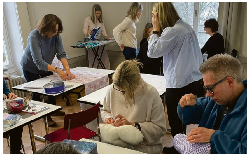
Das «Nähatelier» im Alten Pfarrhaus. Neu zügelnd der Workshop ins KGH Muri.

Sitzungszimmer kostenlos zur Verfügung und machte für mich Werbung. Das war natürlich eine tolle Unterstützung, für die ich dankbar bin.