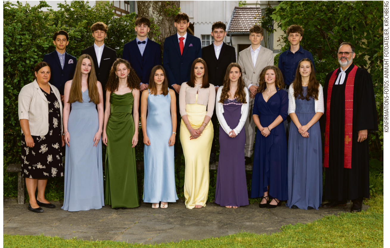
KONFIRMATIONS-FOTOS: ANNUHUT FOTODATELER, KIRCHBERG

38 Jugendliche feierten Mitte Mai ihre Konfirmation; drei wunderschöne Anlässe in der Kirche Gümligen, die uns noch lange in Erinnerung bleiben.