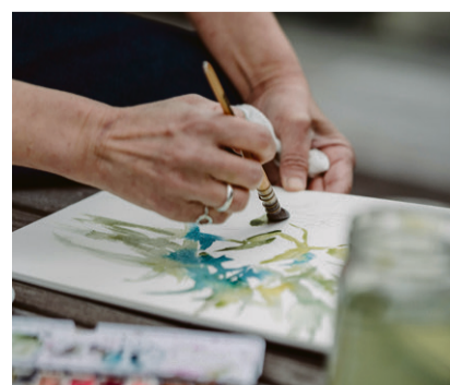
Freitag, 31. Juli 2026: «Creaviva» im Zentrum Paul Klee.