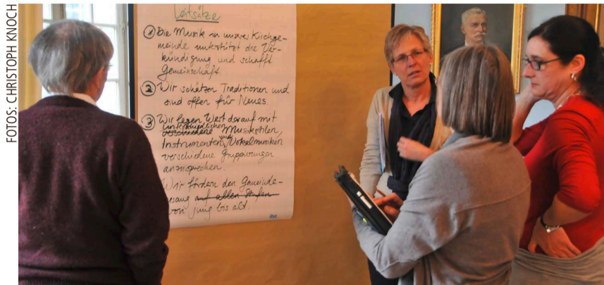
An der Retraite im Februar wurden «Leitsätze zur Musik» entwickelt.

Fantasie ist gefragt. Alle Beteiligten, allen voran die Musikkommission, müssen überlegen, wie dieser und jüngeren Altersgruppen der Besuch in der Kirche attraktiver gemacht